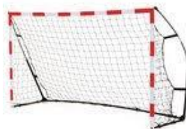
Buts de mini Hand